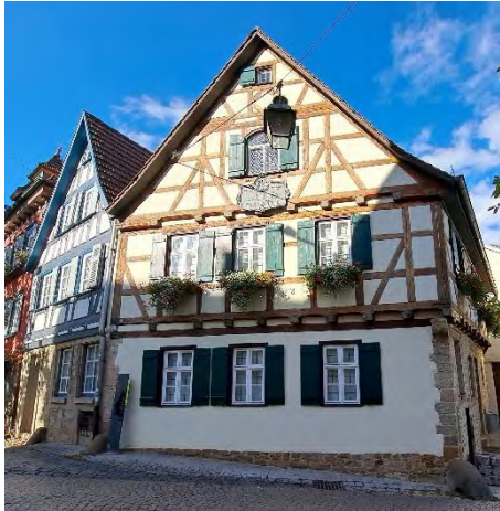
Schillers Geburtshaus Marbach