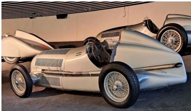
„Silberpfeile“ Mercedes- Benz