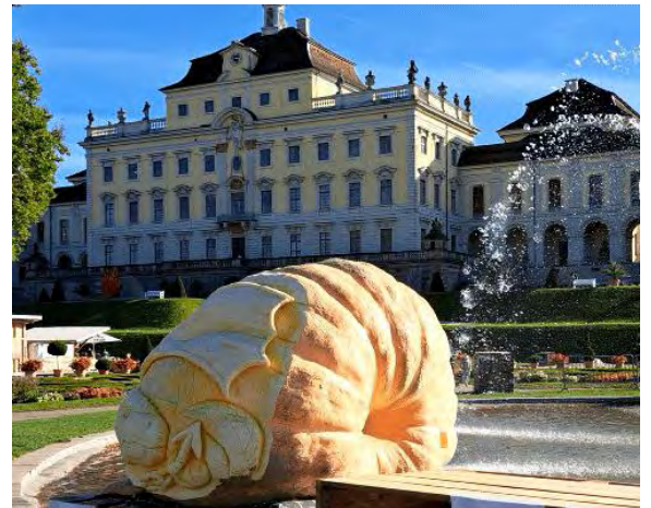
Kürbisse im Schlosspark Ludwigsburg