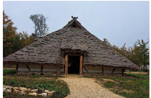
Campus Galli -Scheune