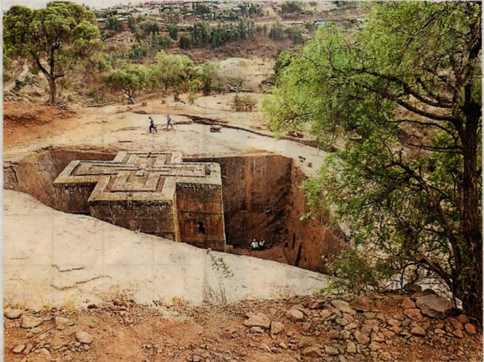
Die Felsenkirche in Lalibela in Nord-Äthiopien.